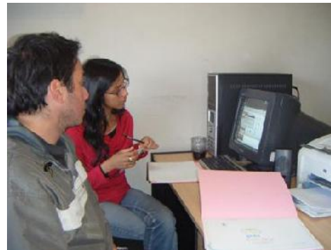
Capacitación Equipos Técnicos. Área Desarrollo Social. 2009

Asimismo, el informar y sensibilizar a formadores de opinión, decisores y periodistas sobre la situación de niños, niñas y adolescentes, y los avances y progresos en el cumplimiento de sus derechos.