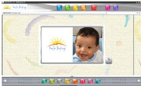
Base InfoJUUJUY 4.4

Soporta tanto indicadores estándar como indicadores definidos por el usuario. La tecnología DEVINFO - INFOJUUJUY, tiene la posibilidad de que el usuario genere reportes de los datos, provee facilidades simples para explorar la base de datos y producir tablas, gráficos y mapas que pueden ser exportables a Word/Excel/PowerPoint.