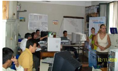
Capacitan Equipos Técnicos Educación

El proyecto consta de la construcción de indicadores sociales sobre Niñez y Adolescencia, incluyendo Inversiones Económicas. Prosigue con la sistematización de los mismos, y la carga en el software INFOJUUJUY 4.0, adaptación del programa DEVINFO 6.0.